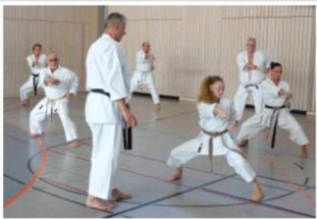
RKV Lehrgang 2014 (bei ganz viel Text bleibt alles unterhalb des Bildes)

Unterschied Beschriftung in Bild Details (li.) oder im Textfeld (re.)