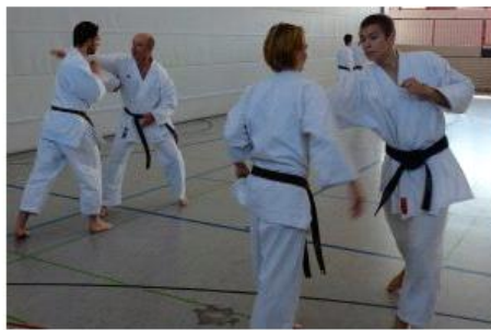
RKV Lehrgang 2014 (bei ganz viel Text muss man sich selbst um die Formatierung kümmern)